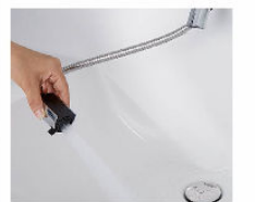
ホースを引き出して、ボウル手前に水を流すこともできます。